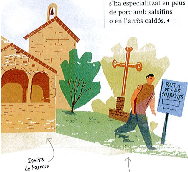
Ermita de Farners

✉ Ctra. de Sils, 36 | ☎ 972 84 12 13 | 🌐 www.triasbiscuits.com